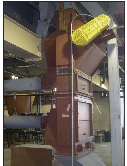
Vista completa del sistema de lazo de aspiración Crown.