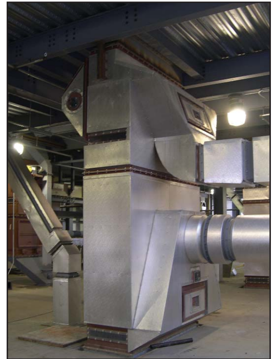
Aspirador en Cascada Crown

El alimentador se diseño para uso rudo, y para tener una alimentación continua y uniforme del producto alimentado a través de todo lo ancho de la unidad. Esta unidad se diseño para mantener un sello en la alimentación, y cuando esta equipado con sistema de control de nivel (opcional) con su alimentador de velocidad variable, se obtiene un sistema completo de alimentación automático.