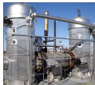
Condensação a Frio (Ice Condensing)