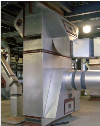
Enfriador cascada crown