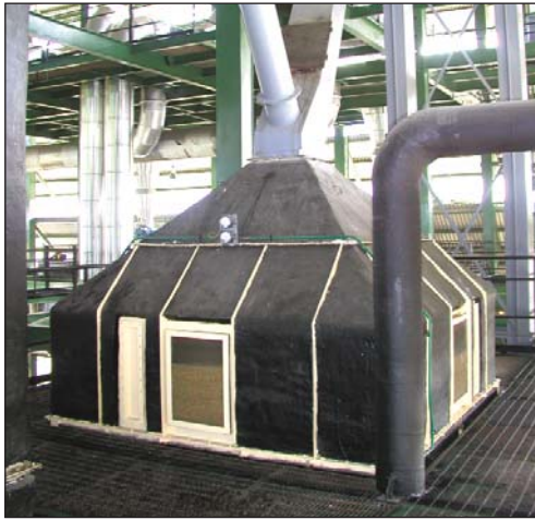
Alimentación Acondicionador vertical de granos Crown.