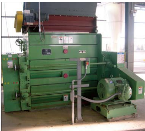
Separador de cascarilla por rodillo lisos